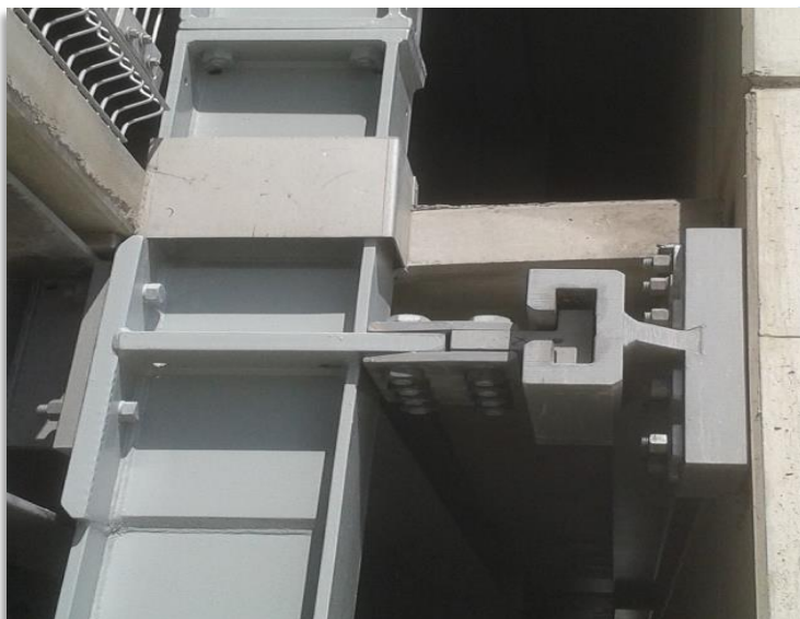
PGslide® Zug- / Druck-Gleitlager